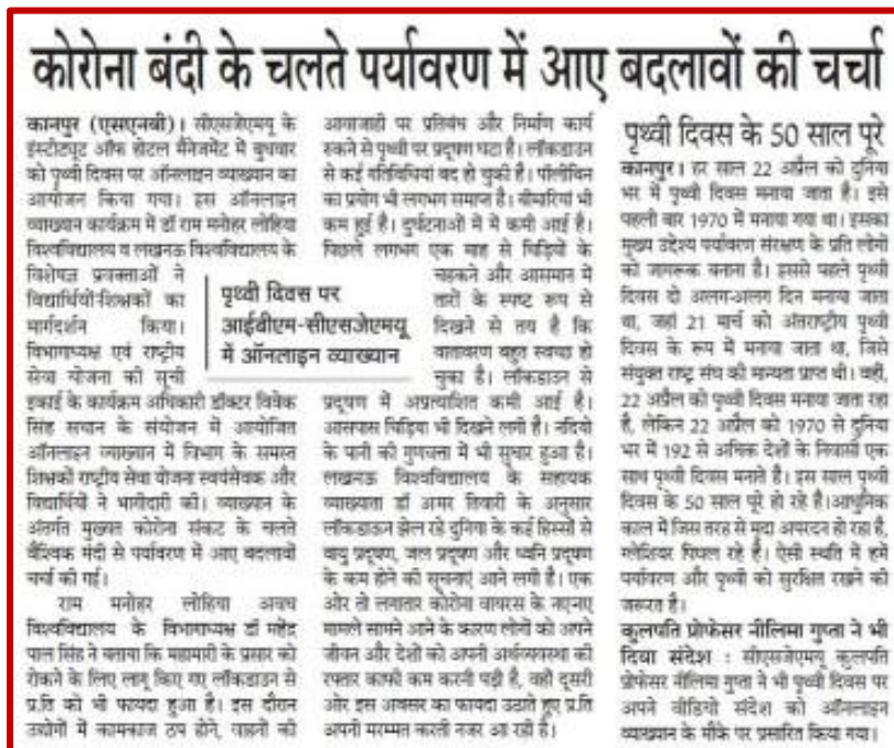
Figure 20 Lecture on COVID-19 students of UIHM and NSS-3 Unit

Organized a lecture for students of the Institute of Hotel and Tourism Management and volunteers of NSS unit 3rd CSJM University Kanpur on the occasion of Earth Day.