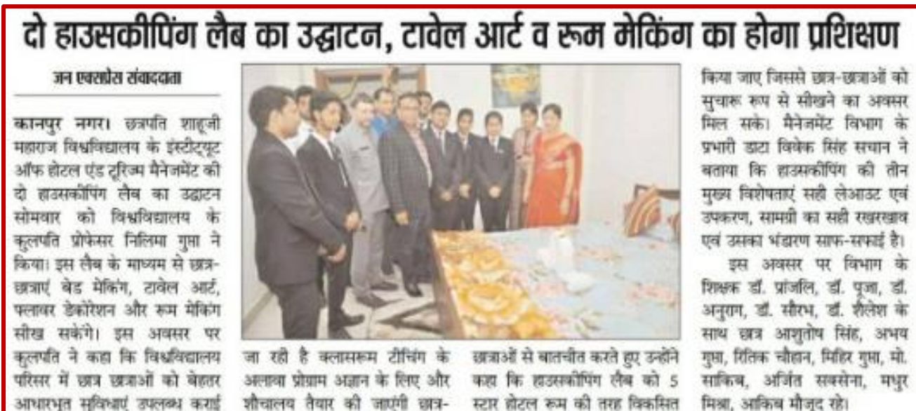
Figure 12 Inauguration of House Keeping Lab by Hon'ble Vice Chancellor Madam