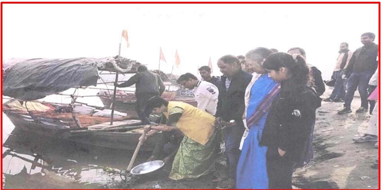
Figure 25 Ganga Cleaning program by Unit-2 in presence of Hon'ble Vice Chancellor madam

Details of the Programme: शिक्षा विभाग के छात्रों एवं एन0एस0एस0 स्वयंसेवक, छत्रपति शाहू जी महाराज विश्वविद्यालय, कानपुर द्वारा दिनांक 31 श्रंदए 2020 को निकटम स्थित बस्ती में गंगा यात्रा निकालकर लोगों को गंगा स्वच्छता के प्रति जागरूक किया गया और गंगा स्वच्छ बनाये रखने के लिए प्रेरित किया।