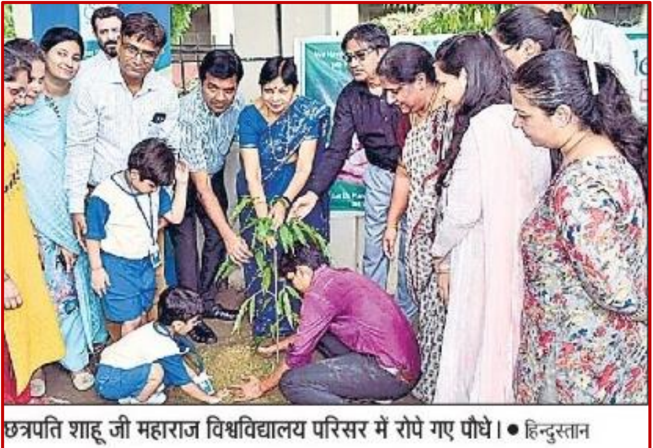
Figure 4 Plantation drive by NSS Unit-3 in presence of students, Registrar and Hon'ble Vice Chancellor Madam