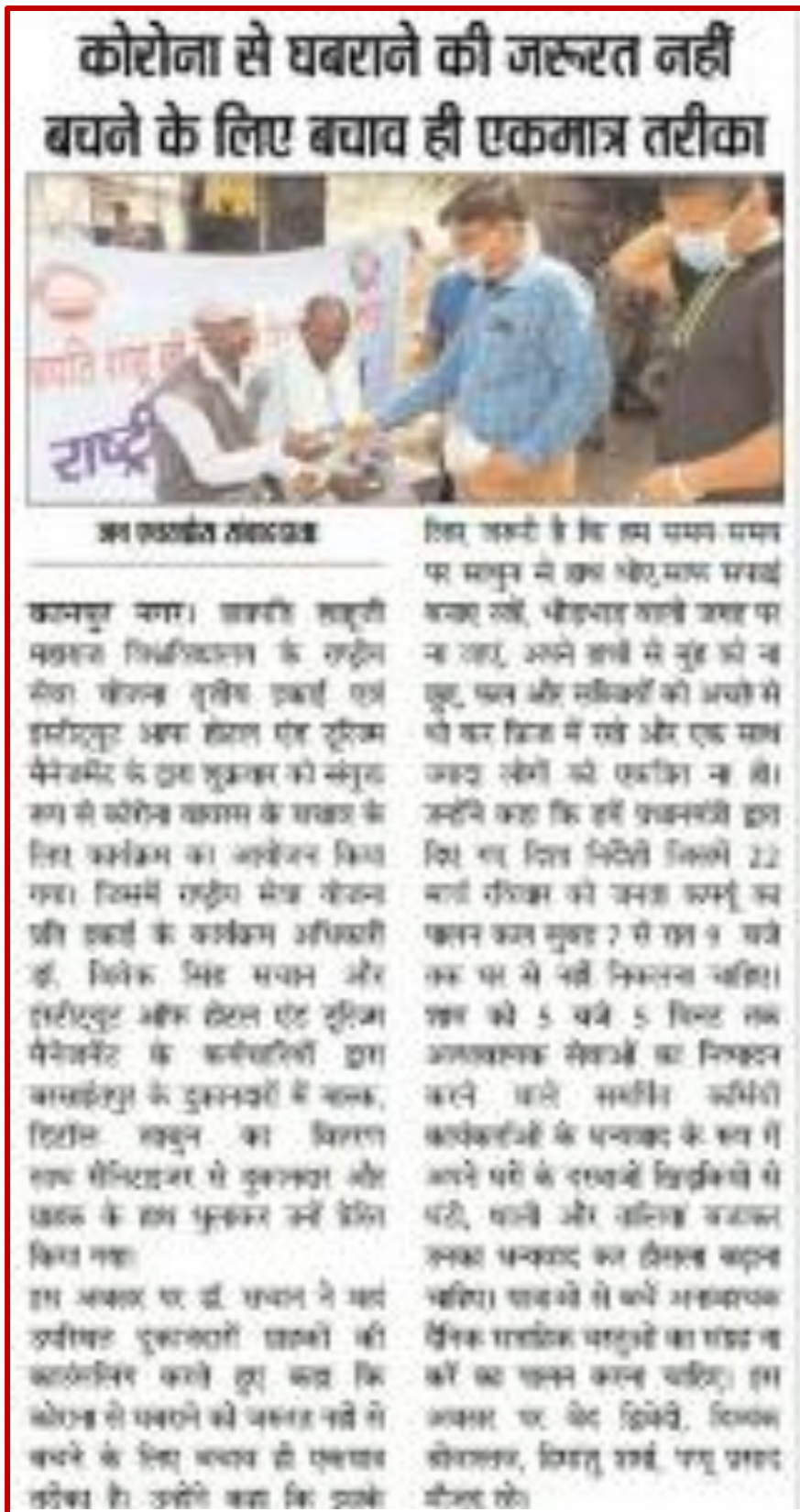
Figure 15 Distribution of Sanitizer, Mask for COVID-19 awareness by NSS-3 Unit

As a Program officer of NSS UNIT 3rd CSJM university Kanpur distributed masks, sanitizer, and soaps at Barsaitpur, Kalyanpur Kanpur.