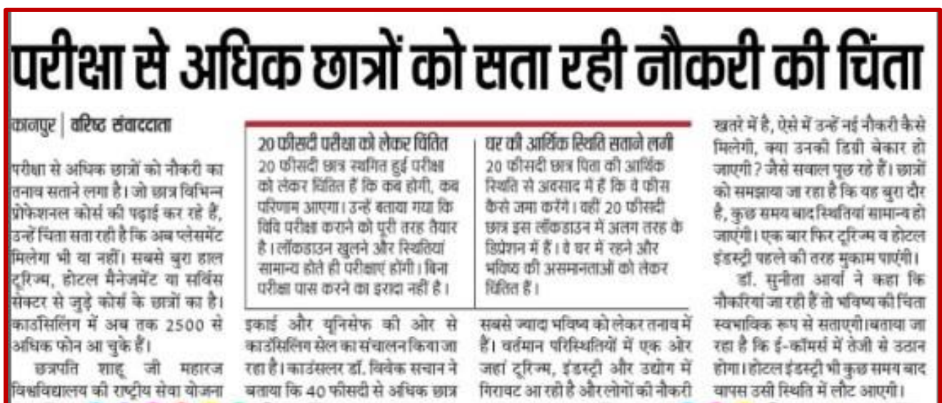
Figure 22 Counseling session by NSS-3 during Lock down

Actively involved in counseling Students under the ages of NSS and UNICEF during Lock Down.