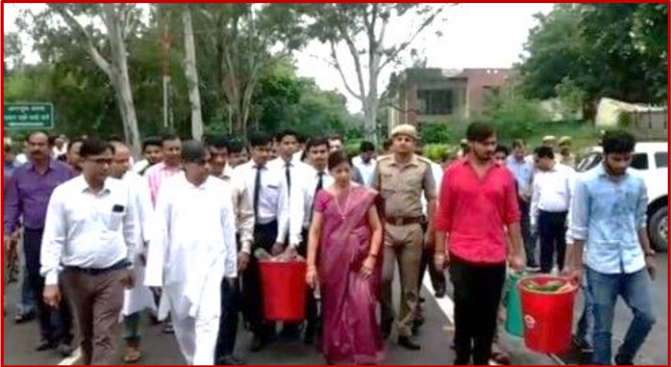
Figure 9 NSS-3 Unit organizes Plogging run and plastic waste collection in presence of Hon'ble Vice Chancellor Madam