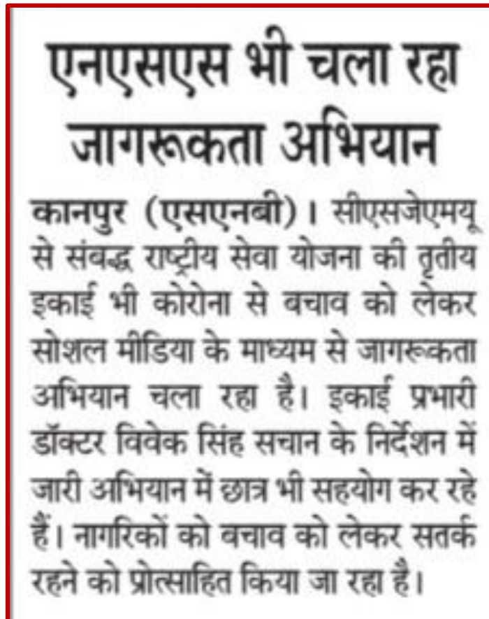
Figure 18 Awareness program by NSS-3 unit during Lock down

All the volunteers of NSS UNIT 3rd CSJM university Kanpur followed the rules of lockdown given by Hon'ble Prime Minister Sri Narendra Modi ji and also create awareness among people to fight against Carona through various modes of social media.