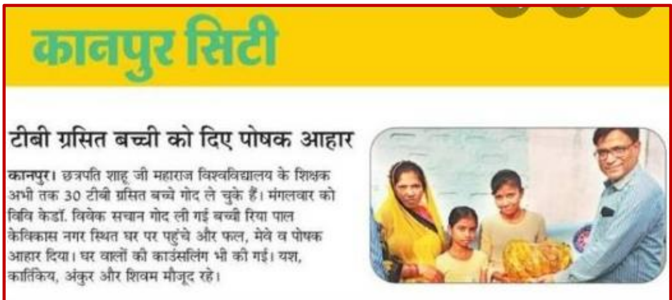
Figure 10 Nutrition supplement distribution to TB patient by NSS-3 Unit

NSS UNIT 3rd CSJM university Kanpur provided fruits and nutritious foods to Adopted TB patient.