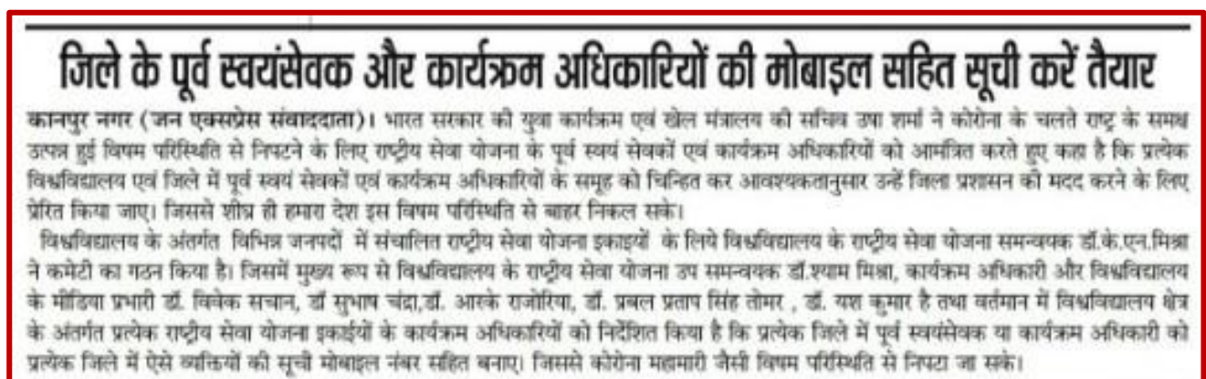
Figure 19 Awareness program by NSS-3 unit during Lock down

NSS Volunteers and Program Officers are doing their best in this period of lockdown.