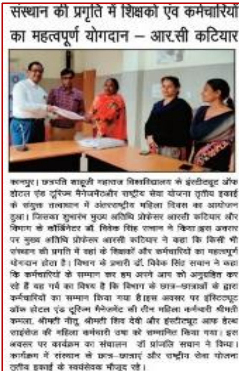
Figure 14 NSS-3 Unit organizes Felicitation program on International Women's Day

Students of the Institute of the hotel and tourism management CSJM university Kanpur and volunteers of NSS UNIT 3rd CSJM university Kanpur on the occasion of International Women's day Felicitated Female staff of Institute of hotel and tourism management CSJM university kanpur and Institute of Health Sciences.