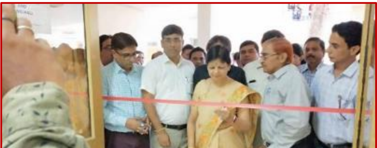
Figure 8 Health Camp Inauguration by Hon'ble Vice Chancellor Madam and Principal JLN Homeopathic college