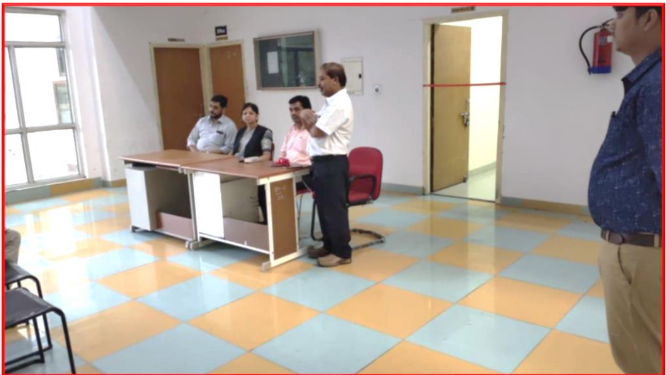
Figure 2 Induction Installation in Hostel of CSJMU in presence of Registrar and Hon'ble Vice Chancellor Madam