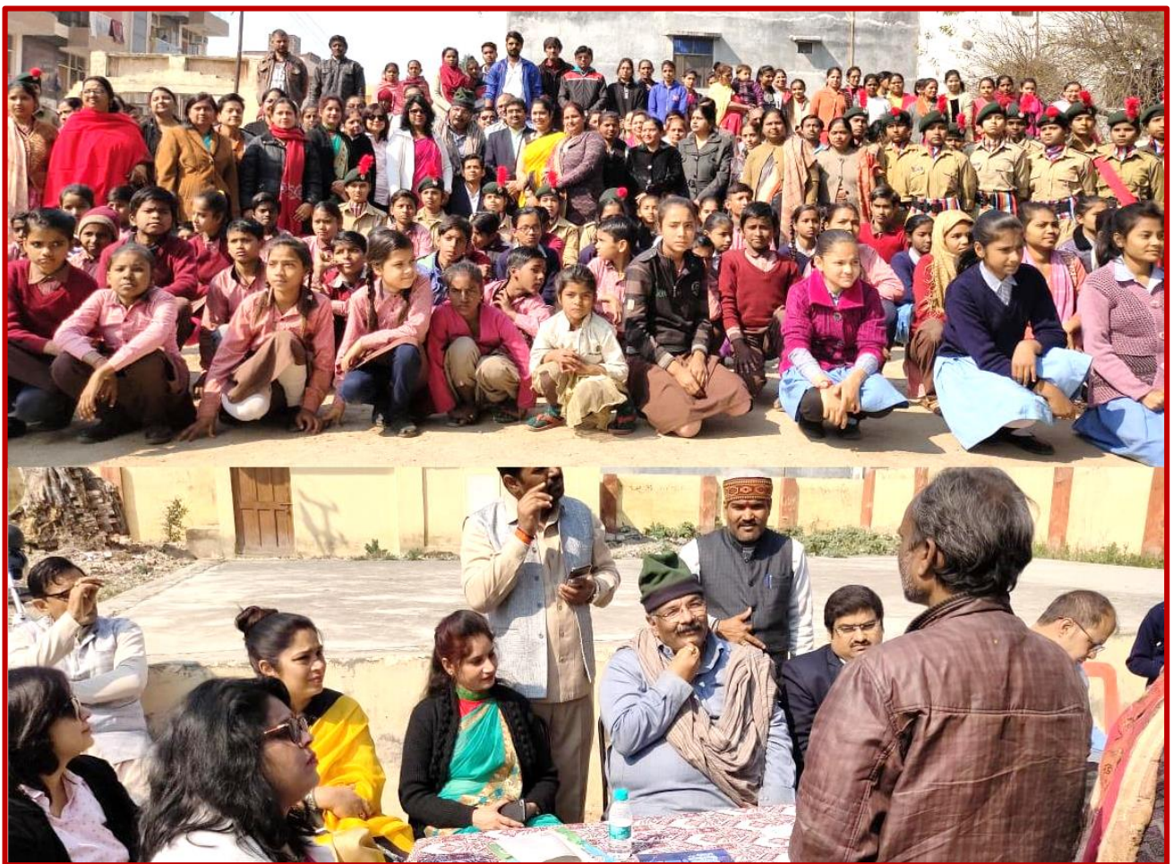
Figure 1 Programme with Dikshank organization in Primary School

Details of the Programme: Department of Social Work and Dikshank Organization organized a meeting with community to increase the enrollment in school and discussed with parents to send their children daily so that children could improve their learning level.