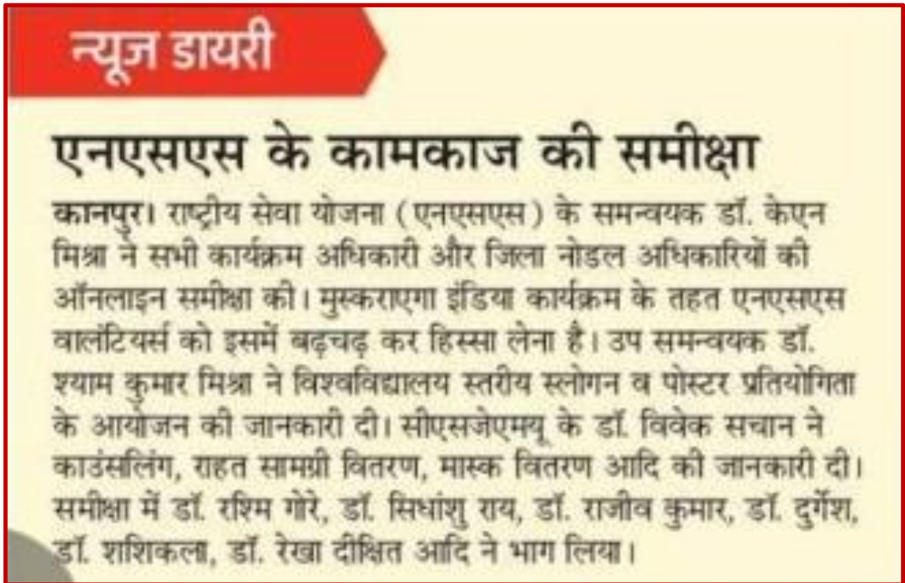
Figure 21 Fight against Corona by NSS-3 Unit

Kanpur is actively participating in the fight against Corona.