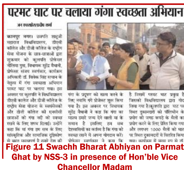
Figure 11 Swachh Bharat Abhiyan on Parmat Ghat by NSS-3 in presence of Hon'ble Vice Chancellor Madam